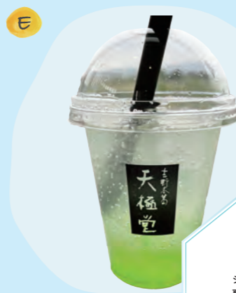
葛もちサイダー (マスカット 500円)

シャリシャリするんの新食感！フローズン果実は果物本来の甘さや酸味が楽しめる。葛を使用してあるので低カロリーなもの◎。