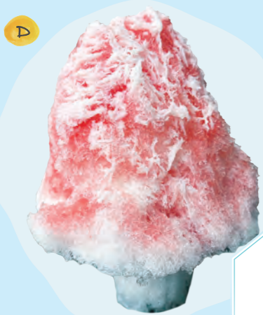
かき氷 (いちごみるく 500円)

2種類のフレーバーをぶるぶるの生地に閉じ込めた洋風水まんじゅう。その輝きはまるで宝石のよう！マンゴー×パッションフルーツの「トパーズ(黄色)」は夏にぴったりの味。