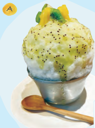
トロピカルサンダー (970円)

日乃出製氷の純氷「大和氷室」を使用。ふわっと軽い口どけの氷は、いちごミルクシロップとの相性バッチリ！