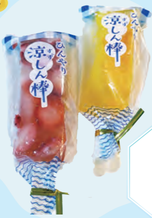
葛バー (イチゴ 330円 / みかん 280円)

ヨーグルトシロップと3種類のトロピカルフルーツ(キウイ・パイナップル・マンゴー)を使用。キウイの酸味が爽やかな夏のかき氷。