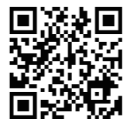
▲情報提供フォーム